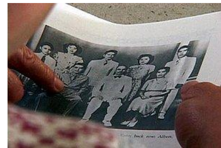
Las fotografías ayudan a menudo al entrevistado para que se acuerde de los nombres y otros detalles de los eventos que deben ser recordados durante la entrevista.