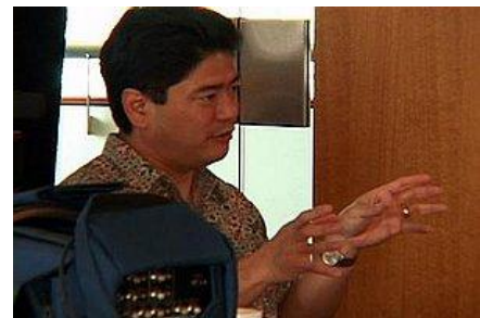
Durante la entrevista, el Dr. Maki usa el lenguaje de cuerpo y el contacto de ojos para estimular las respuestas del narrador.